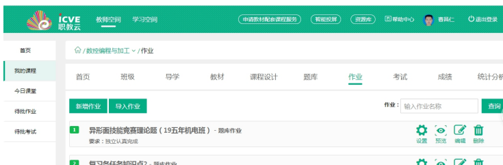
图 2 理论竞赛题